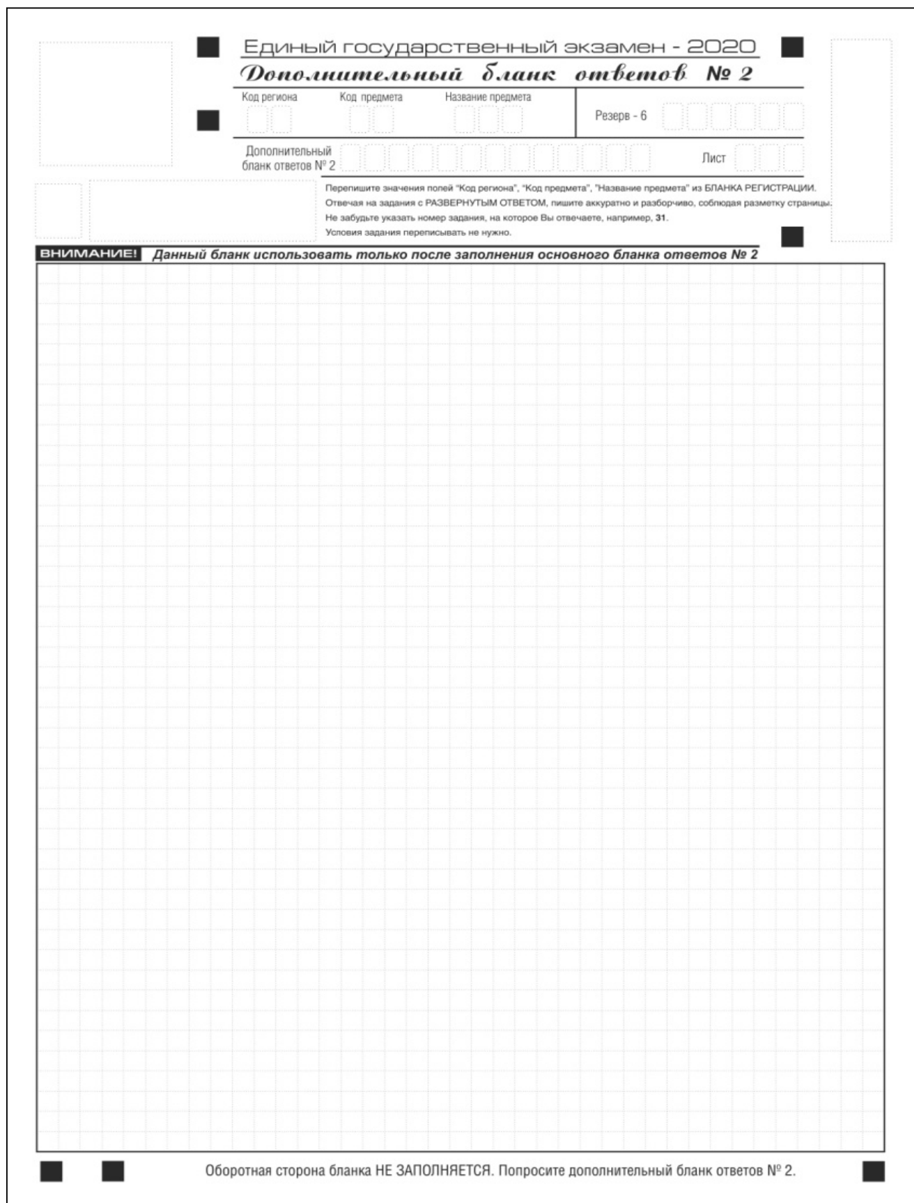
Рис. 15. Дополнительный бланк ответов № 2