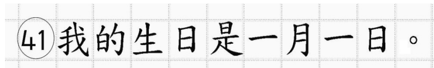
Рис.14. Образец написания иероглифических знаков

иероглифический знак и каждый знак препинания следует писать внутри отдельной клетки области ответов бланка ответов № 2 (дополнительного бланка ответов № 2) (рис. 14).